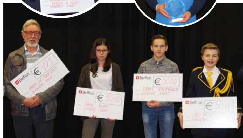
Cultuurkampioenen en winnaar Cultuurprijs