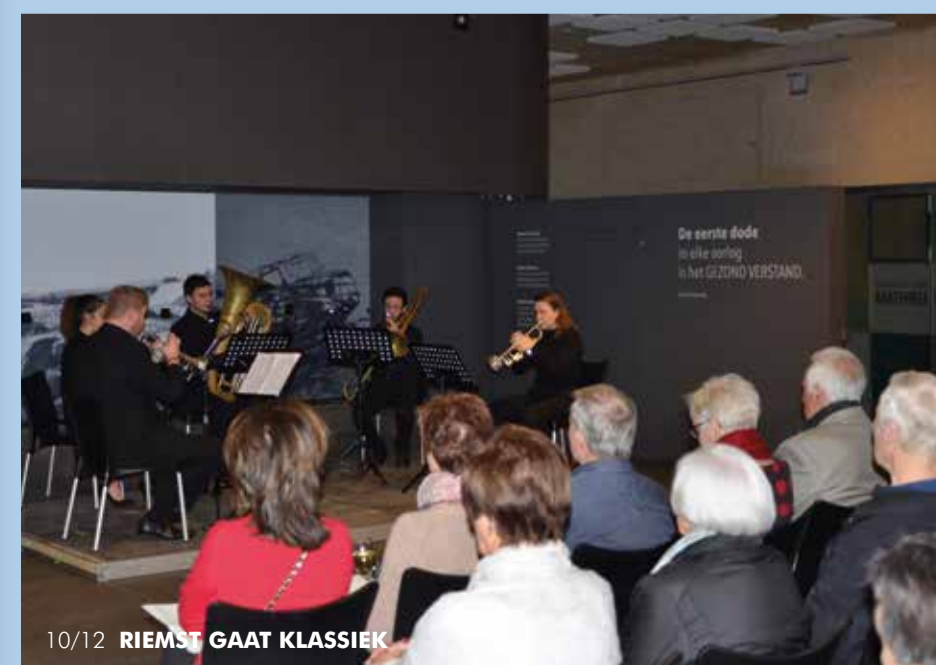
10/12 RIEMST GAAT KLASSIEK