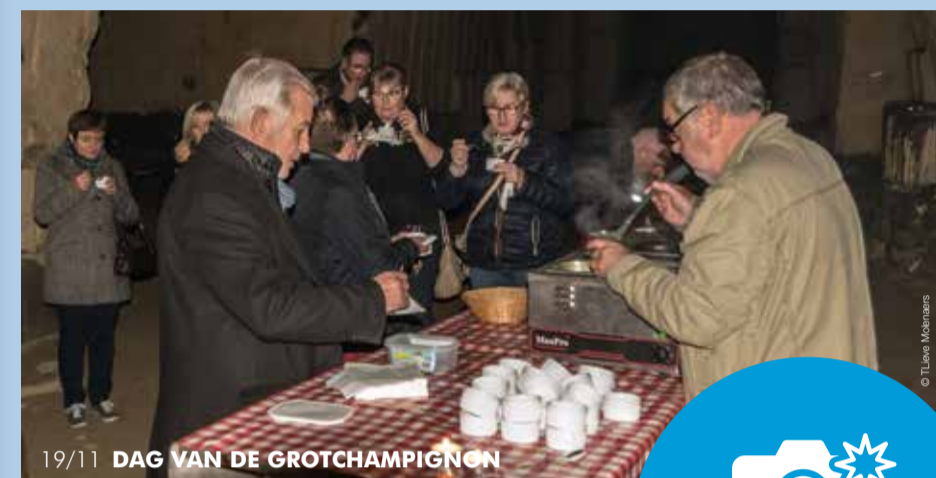
19/11 DAG VAN DE GROTCHAMPIGNON