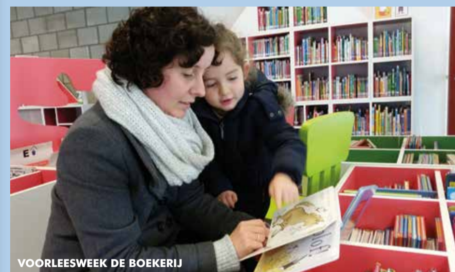
VOORLEESWEEK DE BOEKERIJ