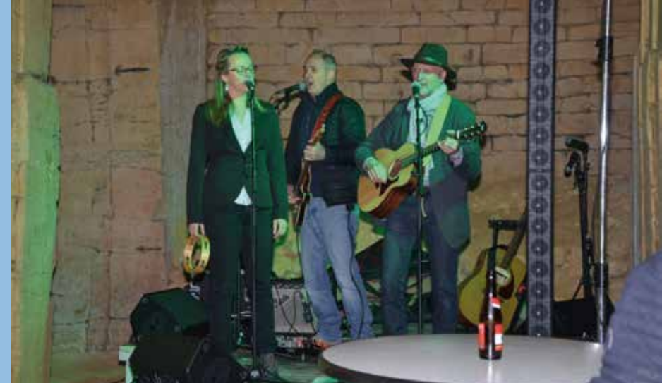
28/04 MELGER HELDEN