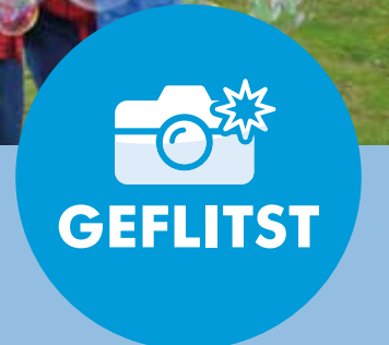
23/04 SENIOREN GAAN TERUG IN DE TIJD TIJDENS ERFGOEDDAG