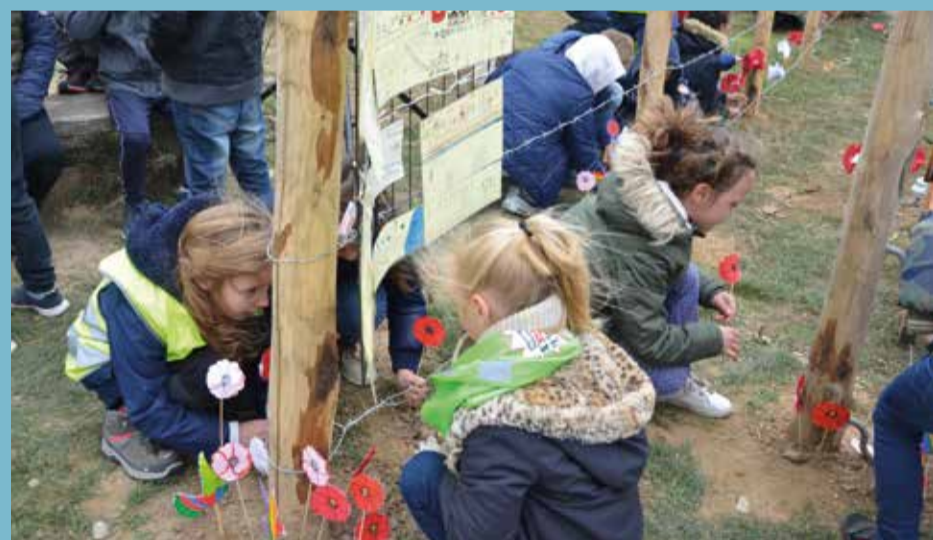
26/10 HERDENKINGSMOMENT DODENDRAAD