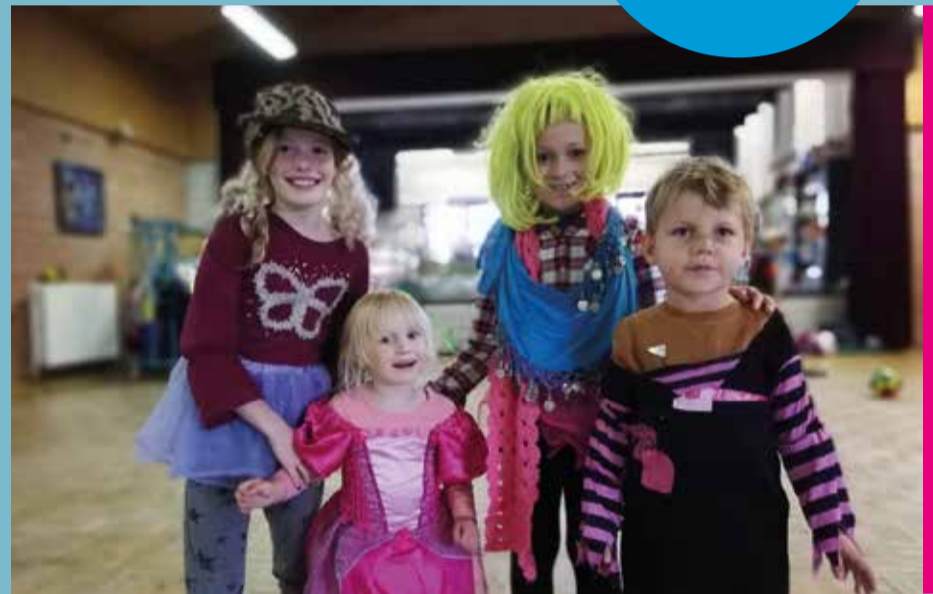
22/10 TOT 26/10 WEEK VAN DE BUITENSCHOLSE KINDEROPVANG