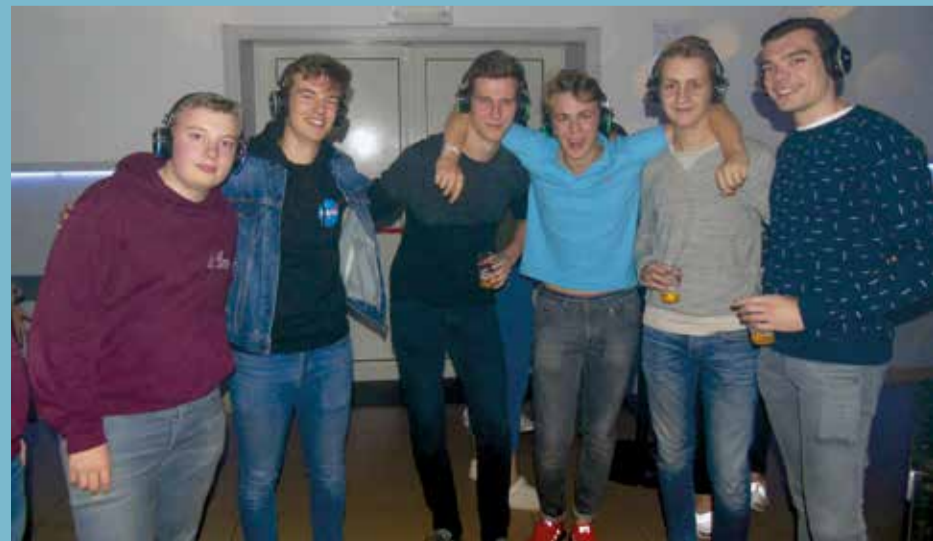
26/10 CULTURODRROOM: SILENT PARTY