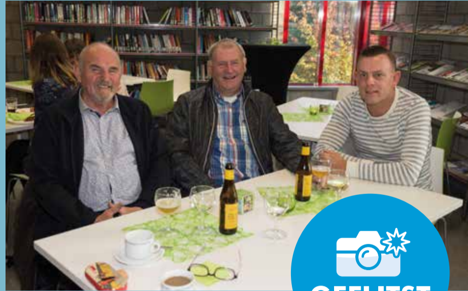
20/10 VERWENDAG DE BOEKERIJ