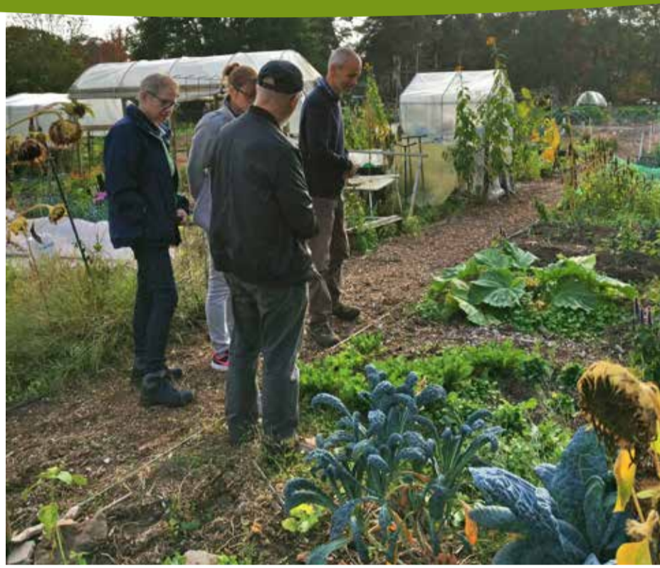
Samentuiniers Riemst op bezoek bij collega's van Bilzen, Hoeselt en Lanaken.

Voor verdere vragen kan u terecht bij tom@be-reikbaarheidsadviseur.be of tel. 011 433 855.